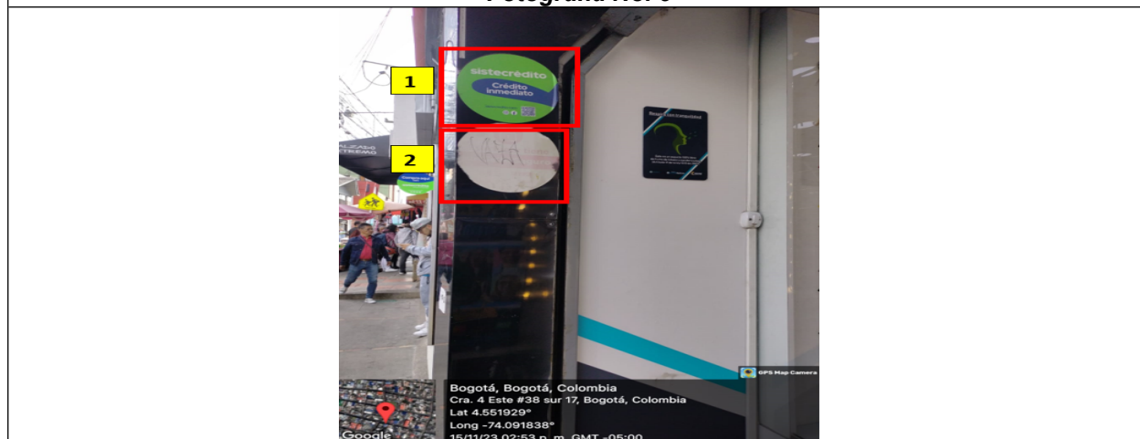
Fotografía No. 5

En la cual se observan: dos (2) elementos PEV identificados con los números 1 y 2 adicionales al único permitido por fachada de establecimiento comercial.